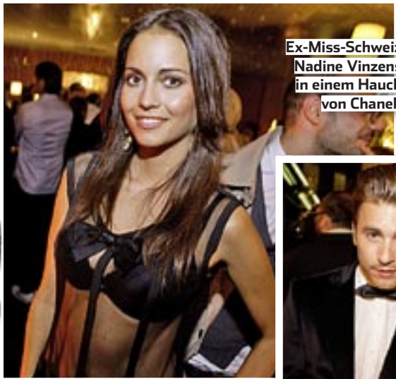
Ex-Miss-Schweiz Nadine Vinzens in einem Hauch von Chanel.