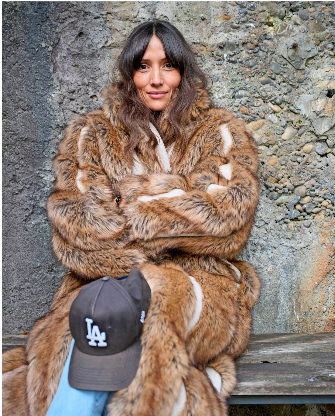
Melanie Winiger stand bereits mit 17 zum ersten Mal vor der Kamera.

Morgens trinke ich Chai Latte. Das gibt mir gute Laune. Ich mache da aber keine grosse Wissenschaft daraus. Es kann auch mal Instant-Chai sein. Abends trinke ich gern mal ein Glas Weisswein oder einen Rosé.